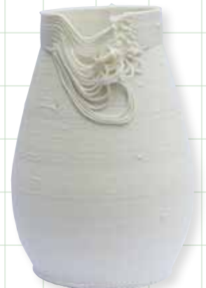
Wie von Hand gemacht: Vase aus dem 3D-Drucker

Was können unsere Hände wirklich gut? Was macht eine Handschrift einzigartig? Wodurch wird ein Werk zum Meisterstück? Die Führung erzählt facettenreiche Geschichten des Handwerks – von der Geschichte der Zünfte bis zu modernen Technologien wie dem 3D-Druck. An den interaktiven Stationen sind handwerkliches Geschick und Fingerspitzengefühl gefragt.